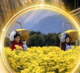
ชมทุ่งดอกเก๊กฮวย สีเหลืองสดใส