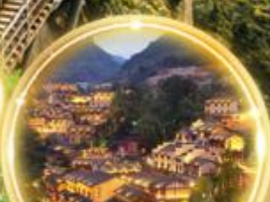
ดื่มด่ำบรรยากาศสุดพิเศษ พร้อมพิทักษ์ในหุบเขา