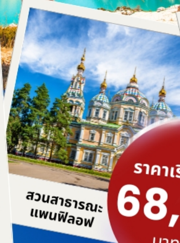
สวนสาธารณะแพนฟิโลฟ