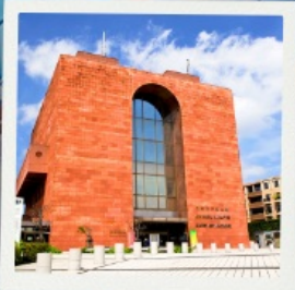
Nagasaki Atomic Bomb Museum