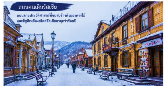
ถนนคนเดินรัสเซีย

ทุกหัวมุมถนนคือแรงบันดาลใจของศิลปิน งานศิลปะที่กลมกลืนกับวิถีชีวิต