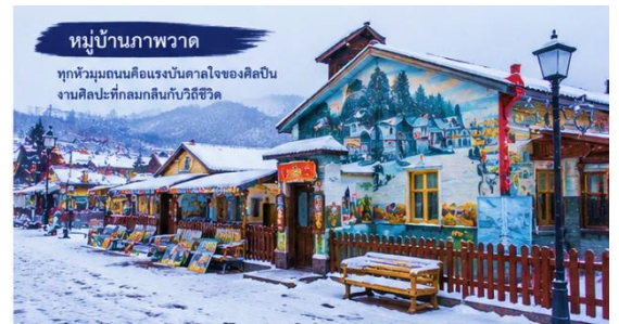
หมู่บ้านภาพวาด

ที่พัก Holiday Inn Express Songbei ระดับ 4 ดาว หรือเทียบเท่า