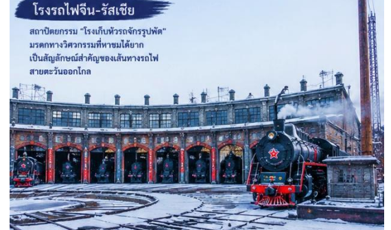
โรงรถไฟจีน-รัสเซีย

โบสถ์ไม้รัสเซียที่สร้างขึ้นโดยไม่ใช้ตะปู ตัวโบสถ์สีเข้มตัดกับสีขาวของหิมะ มอบความรู้สึกสงบและโรแมนติกอย่างบอกไม่ถูก