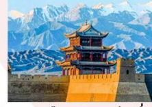
กำแพงเมืองด่านเจียอี้กวน

** พักที่ Cheng Feng Hotel 4* หรือเทียบเท่า **