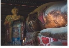
วัดพระใหญ่จางเย่