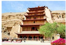
ถ้ำม่อเกาคุ