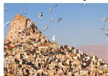
หมู่บ้านของนกพิราบ