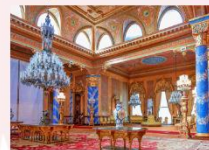
Beylerbeyi Palace ล่องเรือช่องแคบบอสฟอรัส