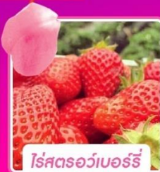
ไร้สตรอว์เบอร์รี่