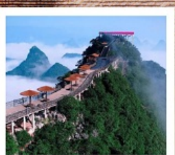
เซาหลูอี้

ล่องเรือใหญ่ชมความงามแม่น้ำหลีเจียง มาซินันโดหลงจี / เซางวงซ่าง / เจดีย์เงินเจดีย์ทอง โซ่วหลิวซานเจีย / เซาหลูอี้ / เมืองลิบไถ่ / กำซลู่ฮ้อ