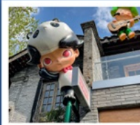
ถนนคนเดินซอยกว้างแคบ