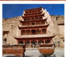
ถ้ำม่อเกา