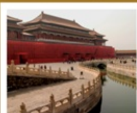
พระราชวังปักกิ่ง