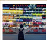
กำแพงมหาวิทยาลัยเหยียนเปียน