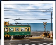
รถไฟเอโนะเดิน