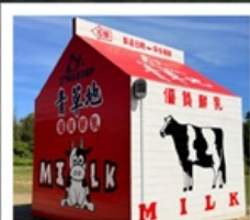
ฟาร์มโคนมจินเหมิน