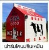
ฟาร์มโคนมจินเหมิน