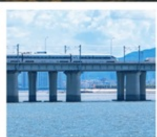
นั่งรถไฟใต้ดินข้ามทะเล