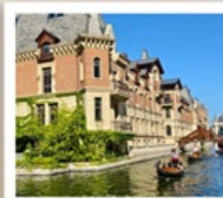
เวนิสแห่งต้าเหลียน