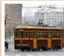
นั่งรถรางชมเมืองต้าเหลียน