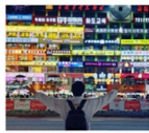
กำแพงมหาวิทยาลัยเหยียนเปียน