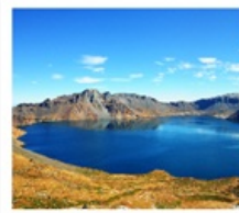
ดางไป่ซาน