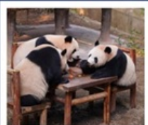
สวนสัตว์ฉางชิ่ง

สวนสัตว์ฉางชิ่ง • เมืองโบราณซือปาเก้ • หมู่บ้านโบราณฉือซีซิว • มหาศาลาประชาคม นั่งรถไฟทะลุติ๊ก • ถนนโบราณหลงเหมินเฮ่า • ถนนเซี่ยเฮ่าหลี • วัดหลิวอัน • Raffles City • หงหยาดัง ถนนคนเดินเจี่ยฟ่างเป่ย์ POP MART • ล่องเรือแม่น้ำแยงซีเกียง • พิพิธภัณฑ์ศิลปะฉางชิ่ง • ตึกชวยซิง 22 ชั้น • THE RING MALL