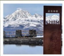
ปาหลางดิงตู