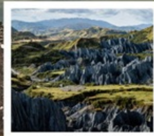
สวนหินป่าเหม่ย