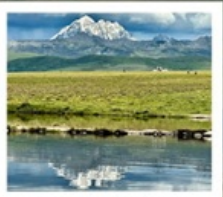
ดวงตาแห่งต่าง