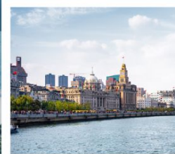
หาดว่อกาน