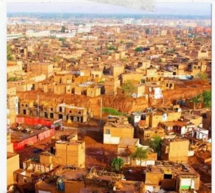
เมืองคาสือ