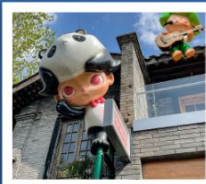
ถนนคนเดินซอยกว้างแคบ