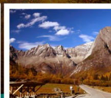
กุหลาบสีดรุณี