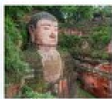
หลวงพ่อดิลเค่อซาน