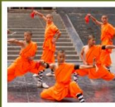
โชว์ลำหลิ้น

กำแพงเมืองโบราณซีอาน / วัดลามะ / ตลาดมุสลิม ป่าเจดีย์ / โชว์การแสดงวิทยายุทธลำหลิ้น / โชว์ราชวงศ์ถัง อุทยานหยุ่นไถซาน / ศาลเจ้ากวนอู / ถ้ำหินหลงเหมิน / วัดลำหลิ้น พิพิธภัณฑ์กองทัพใต้ดินทหารม้าจีน / ถนนคนเดินวัฒนธรรมต้าถิง