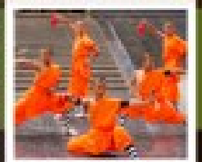
โชว์มูสลิม

PERIOD 1 : 9 - 14 สิงหาคม | PERIOD 2 : 18 - 23 ตุลาคม 2567