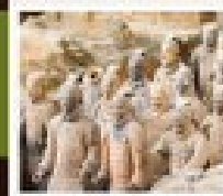
สุถ่าหม่าล่า

วัดสำคัญ / ป่าเจดีย์ / โรงการแสดงวิทยายุทธสำคัญ / อุทยานหยุนโกซาน ศาลเจ้าทวนอู / กำแพงหลงเหมิน / สุสานทหารพันชี / ถนนคนเดินวัฒนธรรมต้าถิง โชว์ราชวงศ์ถัง / กำแพงเมืองโบราณซีอาน / วัดสามะ / ตลาดมูสลิม