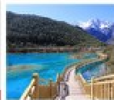
น้ำพุร้อน