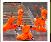
โชว์เส้าหลิน