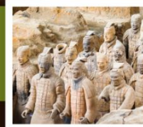
สุสานจีนซี

PERIOD 1 : 9 - 14 สิงหาคม | PERIOD 2 : 18 - 23 ตุลาคม 2567