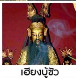
เอียงบู๊ซิว