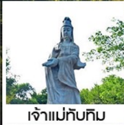
เจ้าแม่ทับทิม