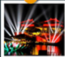
สวนชิงหิงซ่างเหอหยวน