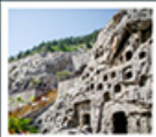
ถ้ำหินหลงเหมิน