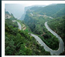
ไท่หิงซาน

หอซุนฮิว / ห้างสรรพสินค้าฟ้างวงหลาย เมืองโก๋เมิ่ง / สวนชิงหิงซ่างเหอหยวน โชว์ราชวงศ์ซ่ง / แกรนด์เทมพลไท่หิงซาน หุบเขาดอกท้อ / ถนนลอยฟ้า หมู่บ้านทิวทัศน์ / 500 กำแพง ถ้ำหินหลงเหมิน / เมืองโบราณทงอี่ โชว์การแสดงวิทยาศาสตร์ล้ำสมัย