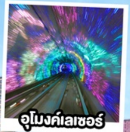
จ๊อเมจค์เลเซอร์