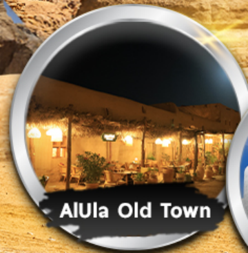
AIUla Old Town