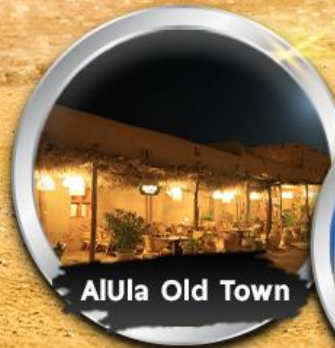
AlUla Old Town