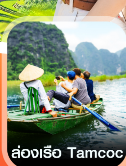
ล่องเรือ Tamcoc