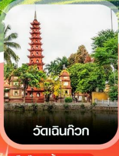
วัดเงินทิว

คอนเฟิร์ม ออกเดินทาง ทุกพีเรียด 2 ท่านขึ้นไป