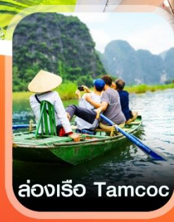
ล่องเรือ Tamcoc