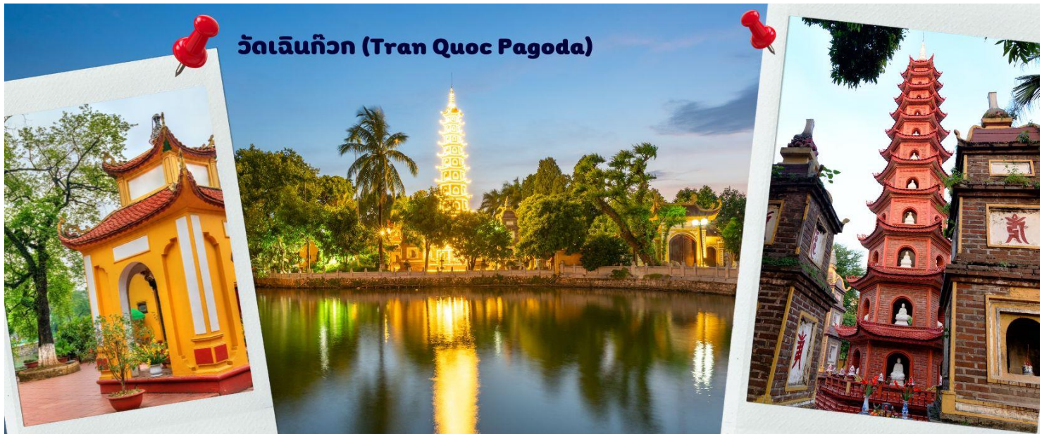
วัดเจินกิวก (Tran Quoc Pagoda)

จากนั้นนำท่านไป วัดเจินกิวก (Tran Quoc Pagoda) เป็นวัดที่อยู่ใจกลางเมืองของเวียดนาม ใกล้ชิดกับทะเลสาบตะวันตกของเมืองฮานอย สร้างด้วยสถาปัตยกรรมจีนโบราณ มีความร่มรื่น และบรรยากาศดี จึงเป็นที่นิยมของ