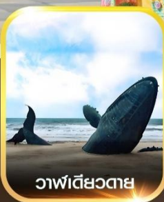
วาฬเดี่ยวตาย

คอนเฟิร์มออกเดินทาง ทุกพีเรียด 2 ท่านขึ้นไป