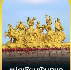
แปดเซียนข้ามทะเล