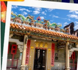
วัดปุกโต