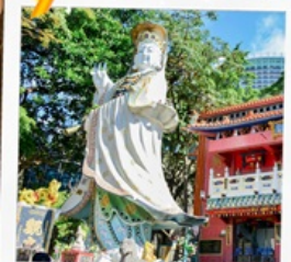
เจ้าแม่กวนอิมรพัสลเบย์

23 กุมภาพันธ์ 2568 วันยืมเงินเจ้าแม่กวนอิม วัดสองอำเภอ