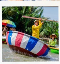
เรือกระดังง์