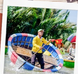
ล่องเรือกระดิง