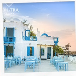
ซานตารีนาคาเฟ่