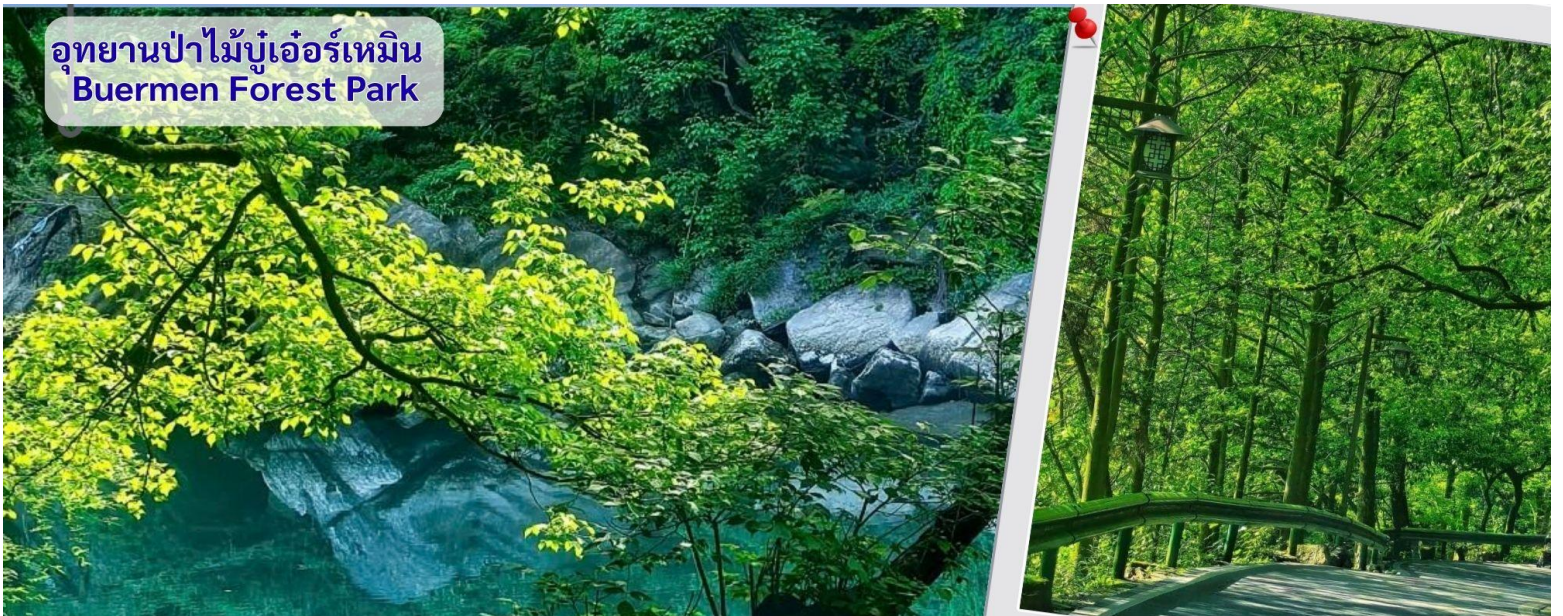
อุทยานป่าไม้บูเออร์เหมิน Buermen Forest Park

นำทุกท่านเดินทางสู่ อุทยานป่าไม้บูเออร์เหมิน (วนอุทยานแห่งชาติหูหนาน จางเจียเจี๋ย) อุทยานแห่งนี้ได้รับการประกาศเป็น อุทยานป่าไม้แห่งชาติของจีน (National Forest Park) ในปี 2006 เป็นสถานที่ท่องเที่ยวทางธรรมชาติและวัฒนธรรม ตั้งอยู่ใน จังหวัดเซียงซี มณฑลหูหนาน ซึ่งเป็นพื้นที่ใกล้เคียงกับเมืองจางเจียเจี๋ย (ประมาณ 2 ชั่วโมงจกจางเจียเจี๋ย) ครอบคลุมพื้นที่กว่า 5,000 เฮกตาร์ โดยมีพื้นที่ป่าไม้ถึง 92% ของอุทยาน โดดเด่นในเรื่องของโขดหินรูปทรงประหลาด บ่อน้ำพุร้อนธรรมชาติ และงานแกะสลักหินโบราณ โดยเฉพาะเพื่อแช่น้ำพุร้อนและชมธรรมชาติภูเขาหินสวย ๆ