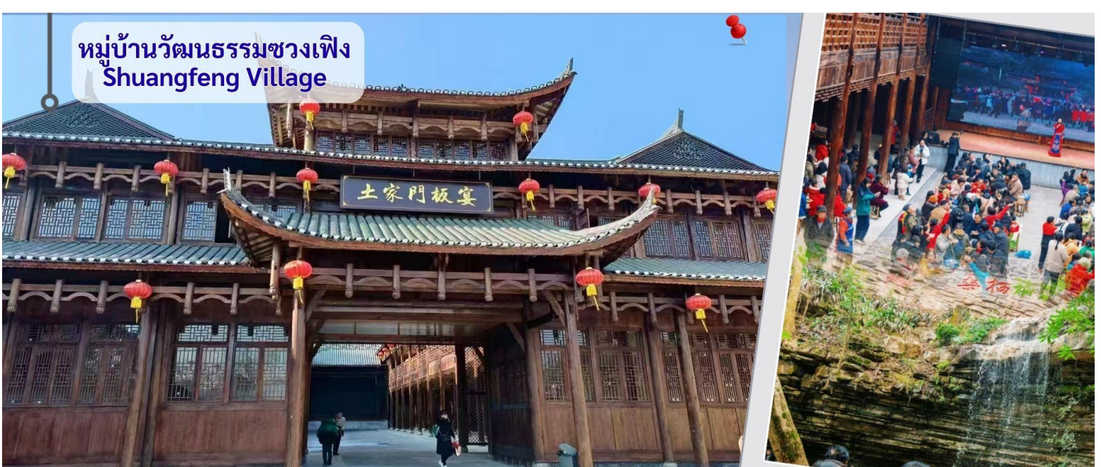
หมู่บ้านวัฒนธรรมชวงเฟิง Shuangfeng Village