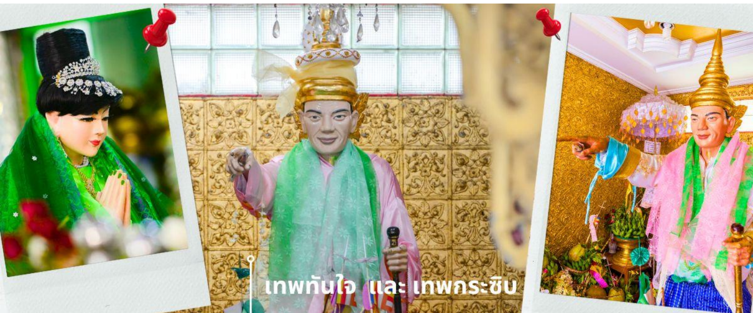
เทพทันใจ และ เทพกระซิบ

เจดีย์โบตาทาว (Botahtaung Pagoda) หมายถึง ทหาร 1,000 นาย เมื่อในอดีตพระเจ้าโองะลาปะกษัตริย์มอญ ได้ให้ทหาร 1,000 นาย ตั้งแถวถวายความเคารพพระเกศาธาตุ บรรจุไว้ 1 เส้น ในเจดีย์นี้ ที่อันเชิญมาจากอินเดีย ไฮไลท์ที่สำคัญที่นักท่องเที่ยวนิยมมาสถานที่แห่งนี้คือ การมาสักการะบูชา เทพทันใจ หรือ นัตโบโบยี และยังมี เทพกระซิบ ภายในเจดีย์เป็นที่เก็บผอบหินทรงสลูพบสมบัติล้ำค่าหลายชนิดเช่น อัญมณี, เครื่องประดับ, เพชรพลอย, จาริกดินเผา, และพระพุทธรูปทองคำ, เงิน, ทองเหลือง, หิน พระพุทธรูปจำนวนทั้งหมดภายในและภายนอกผอบราวกว่า 700 องค์ จาริกดินเผาบางส่วนเป็นเรื่องราวของคำสอนและเรื่องราวทางพุทธศาสนาของนัตโบโบยี หรือ คนไทยรู้จักกันในชื่อว่า เทพทันใจ เป็นคำเรียกเทพเจ้านัต ที่เป็นเทพารักษ์ประจำวัดหรือพระเจดีย์ในศาสนาพุทธแบบพม่า โดยทั่วไปนิยมสร้างรูปเคารพโบโบยี เป็นรูปเคารพชายสูงวัยขนาดเท่าบุคคล สวมเครื่องประดับศิระ บางครั้งถือไม้เท้าเพื่อย้ำถึงความอาวุโส เทพทันใจแห่งนี้ เป็นสถานที่ที่คนไทยให้ความนับถือเป็นอย่างมาก เชื่อกันว่าการได้มาขอพรกับ นัตโบโบยี จะสัมฤทธิ์ผลทุกประการ จนเป็นที่กล่าวถึงและเล่าขานสืบกันมาช้านาน โดยใกล้กันยังมี เทพกระซิบ ซึ่งมีนามว่า “อะมาดอว์เม็ยะ” ตามตำนานกล่าวว่าเป็นธิดาของพญานาค ที่เกิดศรัทธาในพุทธศาสนาอย่างแรงกล้า รักษาศีล ไม่ยอมกินเนื้อสัตว์จนเมื่อสิ้นชีวิตไปกลายเป็นนัต