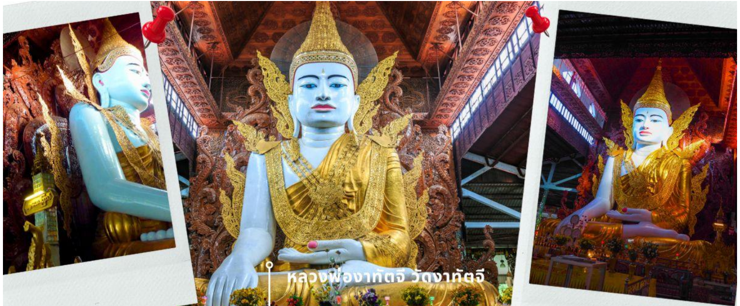
หลวงพ่อกัตจี วัดกัตจี

จากนั้นสักการะ หลวงพ่อกัตจี วัดกัตจี อย่างกึ่ง พม่า เป็นวัดที่ประดิษฐานพระพุทธรูปองค์ใหญ่ นั่นคือ หลวงพ่อกัตจี แปลว่า "หลวงพ่ที่สูงเท่าตึก 5 ชั้น" เป็นพระพุทธรูปปางมารวิชัยที่แกะสลักจากหินอ่อน ทรงเครื่องแบบกษัตริย์ ส่วนด้านหลังเป็นไม้สักแกะสลักลวดลายต่างๆ จำลองแบบมาจากพระพุทธรูปทรงเครื่องสมัยยะตะนะโบง (สมัยมณฑลพายัพ) ส่วนประตูทางเข้าวัดกัตจีก็ประดับตกแต่งอย่างหรูหราด้วยหลังคาสีทองทรงปราสาทแบบพม่า 5 ชั้น และมีรูปปั้นสองสิงห์แบบศิลปะพม่าหรือจีนเต (Chinthe) เป็นทวารบาลอยู่ด้านหน้า วัดกัตจี ตั้งอยู่ที่ Ashay Tawya Monastery เมืองย่างกุ้ง ตรงข้ามวัดเจ้ากัตจี (Chauk Htat Gyi pagoda) หรือที่รู้จักกันในชื่อ “วัดพระตาหวาน” นั่นเอง