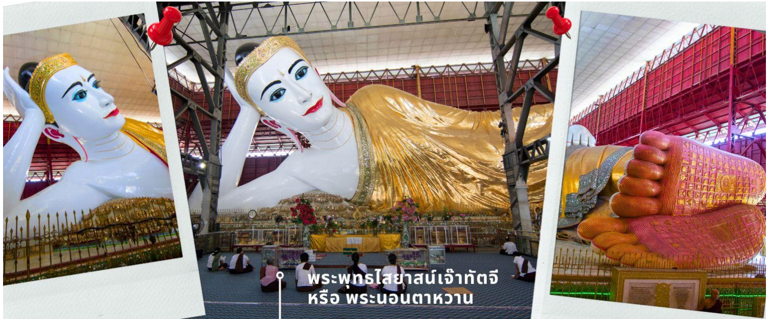
พระพุทธรูปไสยาสน์เจ้ากัตจี หรือ พระนอนตาหวาน

รับประทานอาหารเที่ยง ณ ภัตตาคาร (4) เมนูพิเศษ : ชาบู ปุฟเฟต์ นำท่านสักการะ พระพุทธรูปไสยาสน์เจ้ากัตจี หรือ พระนอนตาหวาน ซึ่งเป็นพระพุทธรูปไสยาสน์องค์ขนาดใหญ่ที่มีความสูงถึง 6 ชั้น ยาวกว่า 70 เมตร ใช้โครงเหล็กกันถึง 65 เมตร มีหลังคาคลุม 6 ชั้น สร้างขึ้นเมื่อปี 1907 ถูกยกย่องให้เป็นพระนอนที่มีขนาดใหญ่และงดงามที่สุดในพม่า ด้วยพระพักตร์ที่งดงามเปื้อนยิ้ม ดวงตาที่จากลูกแก้วที่สังผลิตจากต่างประเทศ ทาขอบตาด้วยสีฟ้าและมีขนตาหนายาวทำให้ดวงตาดูหวาน จนถูกเรียกพระนามอีกชื่อคือ “ พระตาหวาน ” บริเวณพระบาทมีภาพวาดลายธรรมจักร ตรงกลางฝ่าพระบาทล้อมรอบด้วยรูปมงคล 108 ประการ ที่แสดงถึงอากาศโลก สัตว์โลก และสังขารโลก อีกทั้งจิวยังมีลักษณะพริ้วไหวสมจริงและตรงชายประดับด้วยอัญมณีแวววาว ถือเป็นพุทธศิลป์ที่มีความงดงามทรงคุณค่า