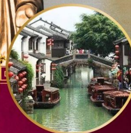
หมู่บ้านโบราณ "ซานถิงเจีย"

วัดหลิงซาน / ศาลาฟานกง(รวมรถราง) หาดไว่ทาน / อุโมงค์เลเซอร์ / หอไข่มุก ถนนนานกิง / วัดพระหยก / ซินเทียนตี้ พิพิธภัณฑ์ผังเมืองเซี่ยงไฮ้ / ตลาด 100 ปี วัดจิ้งอัน(วัดสายมู)