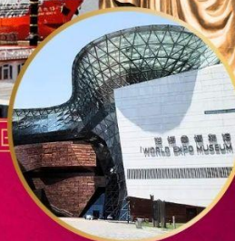
SHA WORLD EXPO MUSEUM