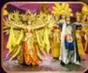
การแสดงโขนจีน-การตา