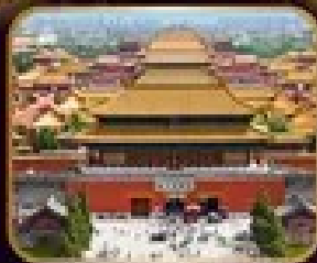
เจ๊ิงมรตโลก