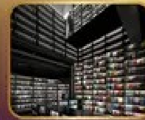
ชมร้านหนังสือ