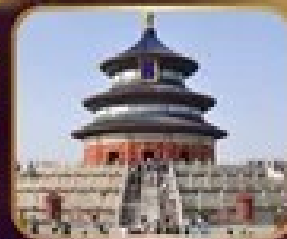
ชมความงดงาม