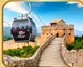
ถ่ายภาพเมืองจีน