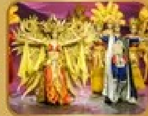
ชมการแสดงโขนจีน