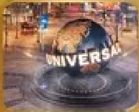
เที่ยวสวนสนุก