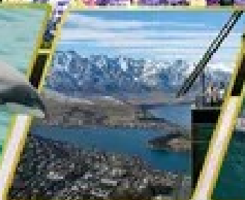
ขุดเขาบ็อนส์ฟิค