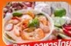
พิเศษ อาหารไทย