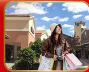
อิสระช้อปปิ้ง BEIJING OUTLET