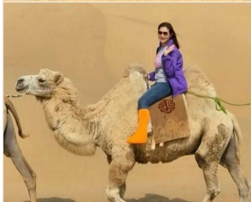
พิเศษ...ขี่อูฐ (รวมค่าขี่อูฐ) สัมผัสประสบการณ์การเดินทางแบบดั้งเดิม