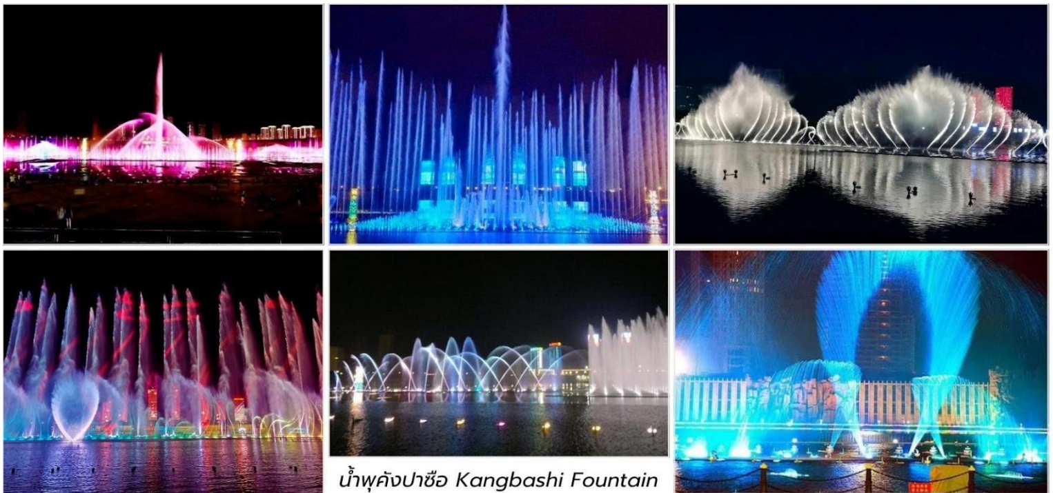
น้ำพุคังปาซื่อ Kangbashi Fountain

นำท่านชม น้ำพุคังปาซื่อ (Kangbashi Fountain, 康巴什喷泉广场)* สัญลักษณ์สำคัญของเมืองใหม่คังปาซื่อ แต่ยังคงได้รับการกล่าวขานว่าเป็นหนึ่งในน้ำพุที่สูงและยิ่งใหญ่ที่สุดในเอเชีย สามารถพ่นน้ำได้สูงถึง 230 เมตร ระบายน้ำพุคังปาซื่อไม่ใช่แค่น้ำพุธรรมดา แต่เป็นการแสดงที่ผสมผสานระหว่างการเคลื่อนไหวของสายน้ำ