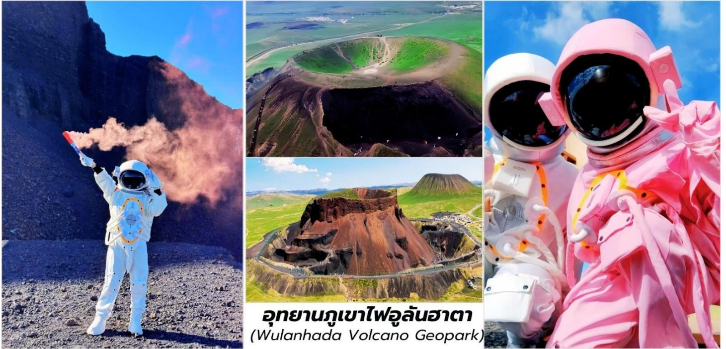
อุทยานภูเขาไฟอูลันฮาตา (Wulanhada Volcano Geopark)

นำท่านชม ภูเขาไฟหมายเลข 6 เป็นภูเขาไฟที่มีลักษณะสีดำเข้มจากหินภูเขาไฟที่ถูกขุดออกไปค่อนข้างมาก ทำให้ดูคล้ายกับพื้นผิวของดวงจันทร์หรือดาวอังคารอย่างชัดเจน ที่นี่เป็นจุดยอดนิยมสำหรับการถ่ายภาพ โดยเฉพาะอย่างยิ่งกับการเช่า พิเศษ...สวมชุดนักบินอวกาศ (รวมค่าชุดแล้ว) ใสเพื่อสร้างบรรยากาศ "การสำรวจอวกาศ"