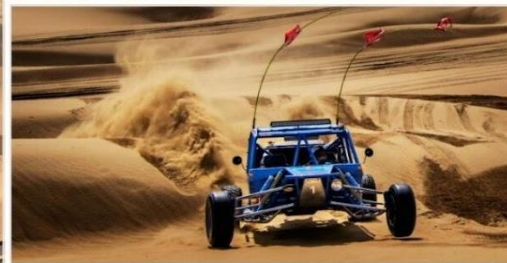
OPTION TOUR เลือกซื้อกิจกรรม สนุกสุดเหวี่ยงในทะเลทราย