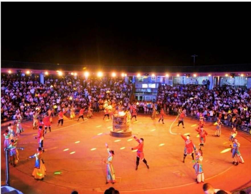
งานราตรีรอบกองไฟมองโกล

คำ บริการอาหารค่ำ ณ ภัตตาคาร พิเศษ สุกี่มองโกล ที่พัก MONGOLIC YURT หรือเทียบเท่า ที่พักรีสอร์ทมองโกล สูดยอดประสบการณ์ที่คุณไม่ควรพลาด การพักผ่อน ท่ามกลางความงดงามอันกว้างใหญ่ของทุ่งหญ้าแห่งมองโกเลียใน