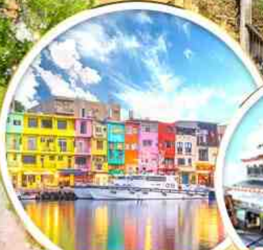
ท่าเรือสายรุ้ง