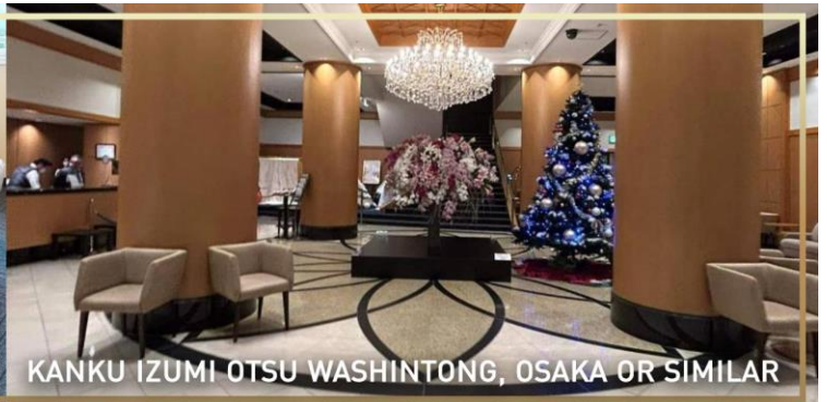
KANKU IZUMI OTSU WASHINTONG, OSAKA OR SIMILAR

วันที่ 5 สนามบินคันไซ – กรุงเทพ (ดอนเมือง)