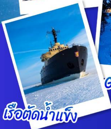
เรือตัดน้ำแข็ง