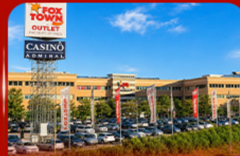
ฟ็อกซ์ทาวน์ ไอทาลี