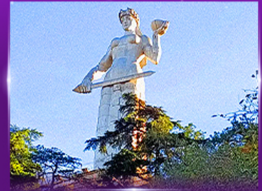
อนุสาวรีย์พระแม่จอร์เจีย