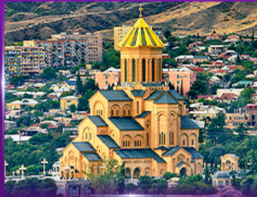
โบสถ์ศักดิ์สิทธิ์ทรีนีตี