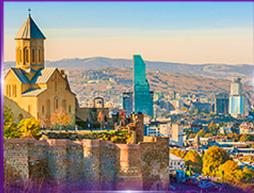
นั่งกระเช้าชมวิว บิอนนาทิการา