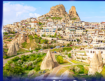
หุบเขาอูซึซาร์ คัปปาโดเกีย